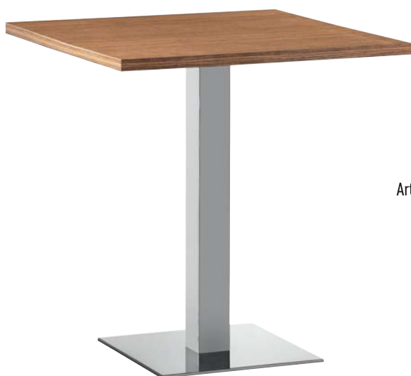
XT design Metalmobil Concept

Maneggevole, versatile e mai fuori luogo, Ibis è una collezione di sedute che comprende: poltroncina impilabile con telaio a quattro gambe, poltroncina impilabile con telaio a slitta, poltroncina con ruote, poltroncina con basamento centrale, sgabello fisso o girevole. Pensata per arredare ambienti interni ed esterni, la collezione Ibis è realizzata con scocca in PP+PET (polipropilene + polietilene tereftalato), tecnopolimero composito multistrato a densità variabile, un atossico e riciclabile al 100%, resistente agli urti, ai detersivi, agli alcool e ai raggi UV. Ibis è disponibile nei colori: bianco, avorio, arancio, grigio perla, giallo e nei nuovi colori verde e antracite.