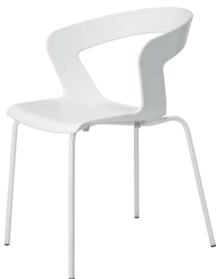
IBIS design Francesco Geraci